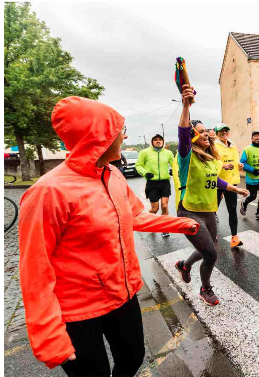
Comme ici à Garlin en 2024, La Passem réunit beaucoup de monde à travers tout le territoire gascon.

nancer divers projets autour de la culture, à travers des livres, des CD ou encore des événements. Pour organiser le tout, plusieurs centaines de bénévoles seront mobilisés à travers le parcours. Deux camions suivront les coureurs, l'un pour les encourager, l'autre pour assurer les secours en cas de problème.