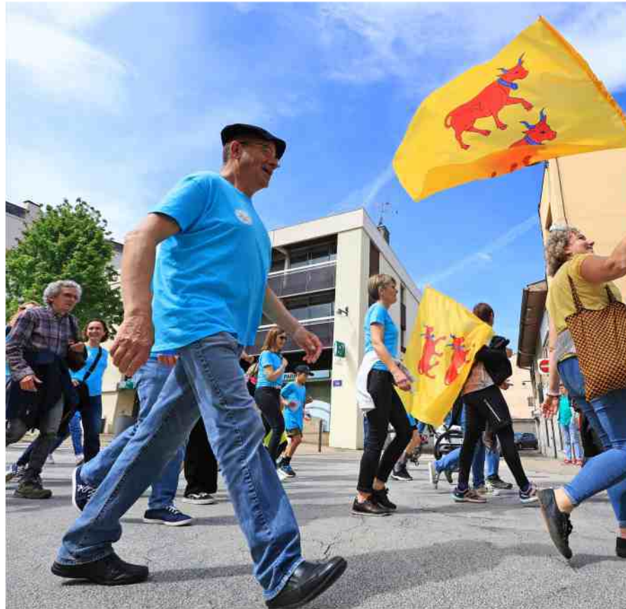
Le 5 mai 2024, après 1 100 kilomètres parcourus en six jours et cinq nuits, La Passem s'achevait à Mont-de-Marsan.

Comme sur le Tour de France, une caravane précèdera le cortège en distribuant des produits dérivés et notamment des kits de jeux pour enfants en occitan. « Les structures Office public de la langue occitane,