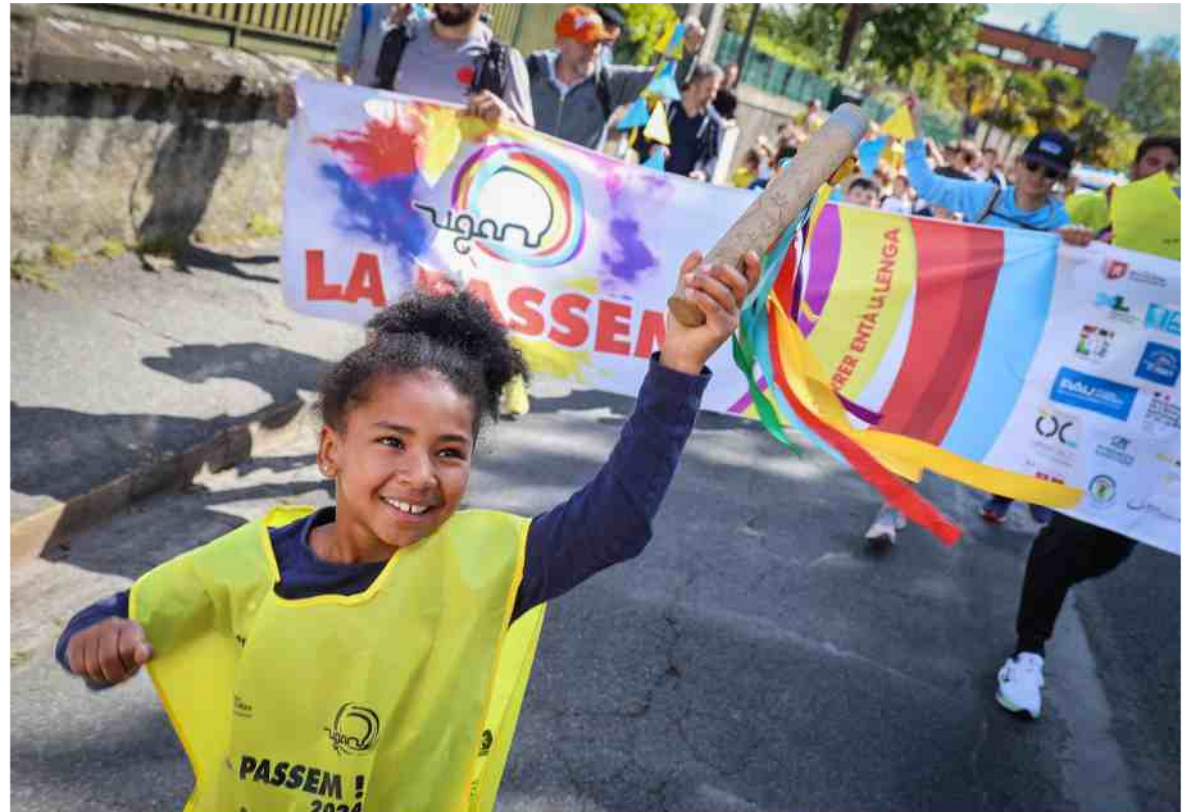
Partout où elle passe, la Passem est synonyme d'animations. GÉRARD SUBERCHICOT

Tout près de l'ancre de l'Hormadi, des structures gonflables permettront au public de tester le hockey mais aussi la pelote basque - avec le champion du monde de pala larga Dan Nécol. Enfin, après l'arrivée de la course peu avant 19 heures, trois spectacles musicaux rythmeront la